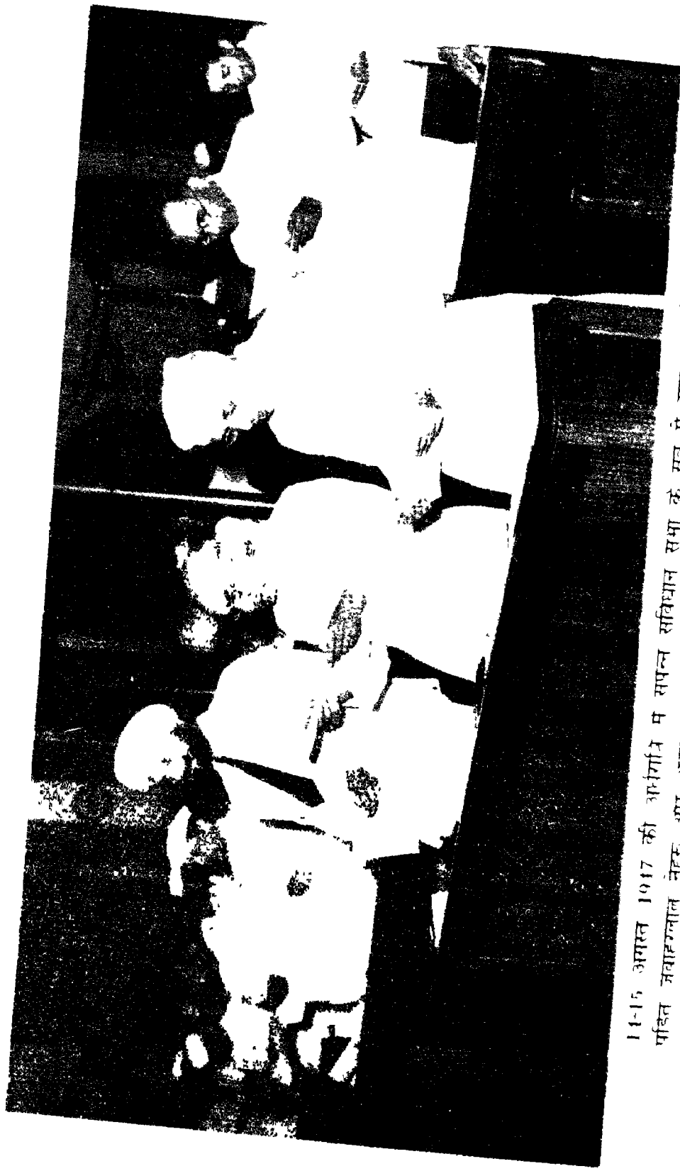
14-15 अगस्त 1947 की असीर्गात्रि में सपन्न सविधान सभा के सत्र में सपदार बलदेव सिन्हा, पंडित त्रिवाङ्गलाल नेहरू और अन्य